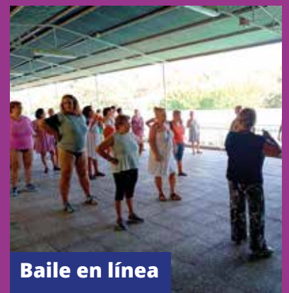
Baile en línea