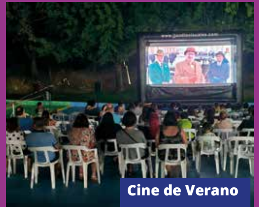
Cine de Verano