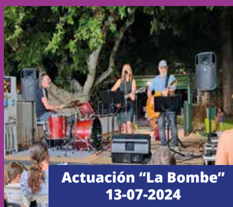
Actuación "La Bombe" 13-07-2024